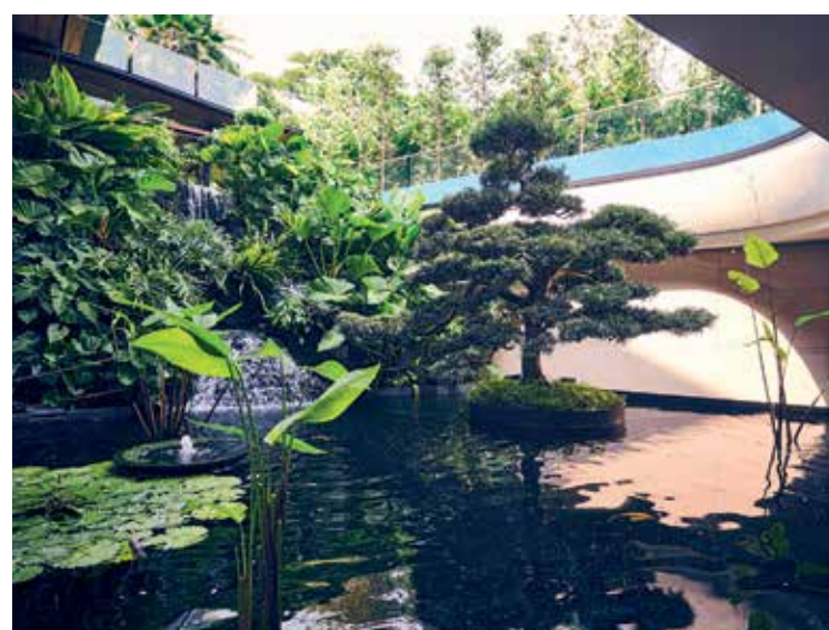
左上起顺时针：三楼的屋顶花园；洋房没有粗大的梁柱，通透且自然；从外部以仰角观看，洋房仿佛悬浮在空中；鱼池上的日本松及荷花等水生植物；在洋房三楼远眺植物园的绿树。